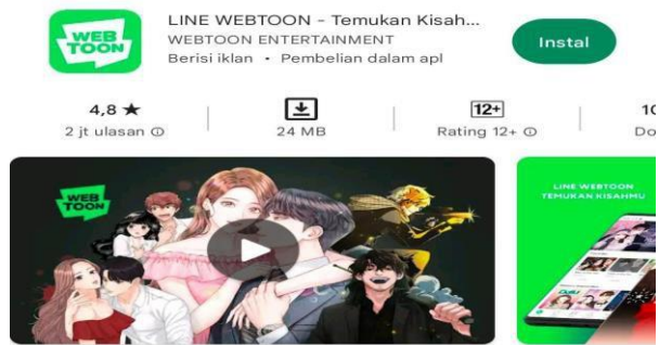
Gambar 1. Tampilan aplikasi webtoon di play store