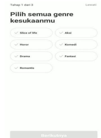
Gambar 3. Tampilan halaman pertama.