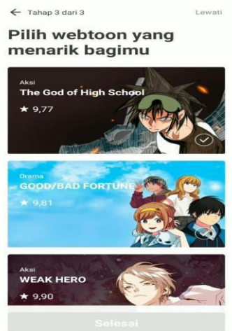
Gambar 5. Tampilan halaman ketiga.