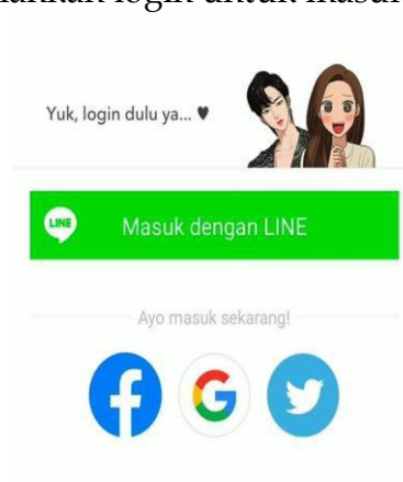
Gambar 6. Tampilan halaman login.

Berikut ini tahapan dalam mengimplementasikan aplikasi webtoon sebagai media pembelajaran untuk meningkatkan minat baca bagi peserta didik: