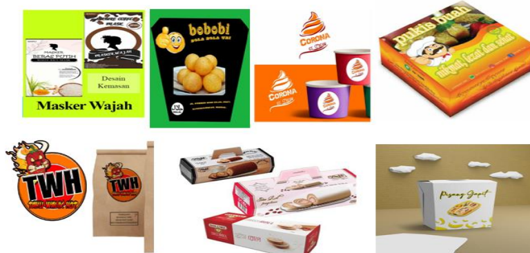
Gambar 2. Hasil Desain Kemasan Produk

Hasil penilaian kuesioner gaya belajar akomodator mahasiswa yang terdapat dalam kelas eksperimen menunjukkan bahwa gaya belajar mahasiswa yang menyukai pengalaman ( concrete experience ) sebesar 31,43% atau 11 mahasiswa dan gaya belajar mahasiswa yang aktif bereksperimen ( active experimentation ) sebesar 68,57% atau 24 mahasiswa. Pembelajaran kewirausahaan yang didasarkan pada gaya belajar akomodator menerapkan materi: (1) Entrepreneurial Mindset ; (2) Building an Islamic Entrepreneur ; (3) Create Business Idea ; (4) Peluang dan Potensi Bisnis ; (5) Business Plan ; (6) Product, Service, & Price ; and (7) New Product Development, Services, and Brands: Building Customer Service Value . Gambaran desain produk yang dihasilkan oleh 7 kelompok kerja mahasiswa yaitu nature coffe mask, corona ice cream, bobobi, tahu walik hot, pukis buah, bokussa, dan pisang gapit. Hasil penilaian portofolio menunjukkan sebanyak 22 mahasiswa atau sebesar 62,86% memiliki nilai belajar sangat baik (nilai rata-rata portofolio 81-100), dan 13 mahasiswa atau 37,14% memiliki nilai belajar baik (nilai rata-rata portofolio 71-80). Gambar desain produk yang dihasilkan oleh mahasiswa adalah sebagai berikut.