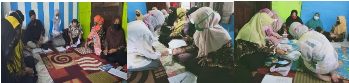
Gambar 2. Kegiatan Pelatihan Internet Marketing dan Praktek Membuat Beberapa Akun di Media Sosial

Kegiatan pelatihan internet marketing dimulai dengan pemaparan secara singkat mengenai apa itu internet marketing, apa yang harus disiapkan dalam internet marketing, cara membuat beberapa akun bisnis untuk memaksimalkan jualan produk, bagaimana membuat foto produk yang menarik, evaluasi produk secara rutin dan dilanjutkan dengan diskusi. Selanjutnya narasumber langsung mengajak seluruh peserta untuk praktek memanfaatkan fitur WA bisnis, membuat beberapa akun media sosial seperti facebook, Instagram dan Shopee. Narasumber mengajarkan step by step agar dapat diikuti dengan mudah oleh seluruh peserta. Kegiatan pelatihan internet marketing dapat dilihat pada Gambar 2.