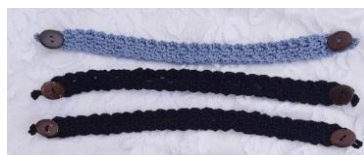
Gambar 1. Produk Crochet

Upaya pengembangan diri dan kelompok terus dilakukan oleh ibu-ibu davis di desa Bantarwuni, salah satunya adalah dengan mengikuti pelatihan kerajinan tangan menggunakan teknik crochet yang diadakan oleh Universitas Amikom Purwokerto. Berbekal ketrampilan yang telah dimiliki ibu-ibu davis di desa Bantarwuni RT 03 RT 03 Kecamatan Kembaran dalam membuat kerajinan tangan menggunakan teknik crochet harus terus didukung agar ketrampilan yang telah dimiliki dapat menjadi peluang usaha rumahan dalam memperoleh penghasilan. Permasalahan yang muncul adalah terbatasnya pengetahuan yang dimiliki ibu-ibu davis dalam memasarkan produk yang dihasilkan. Selama ini penawaran produk crochet yang dihasilkan baru sebatas lewat WA story, sehingga belum banyak pelanggan dan juga belum banyak yang mengetahui produk crochet yang dihasilkan oleh ibu-ibu davis. Adapun produk crochet yang dihasilkan dari pelatihan tersebut dapat dilihat pada Gambar 1 berikut: